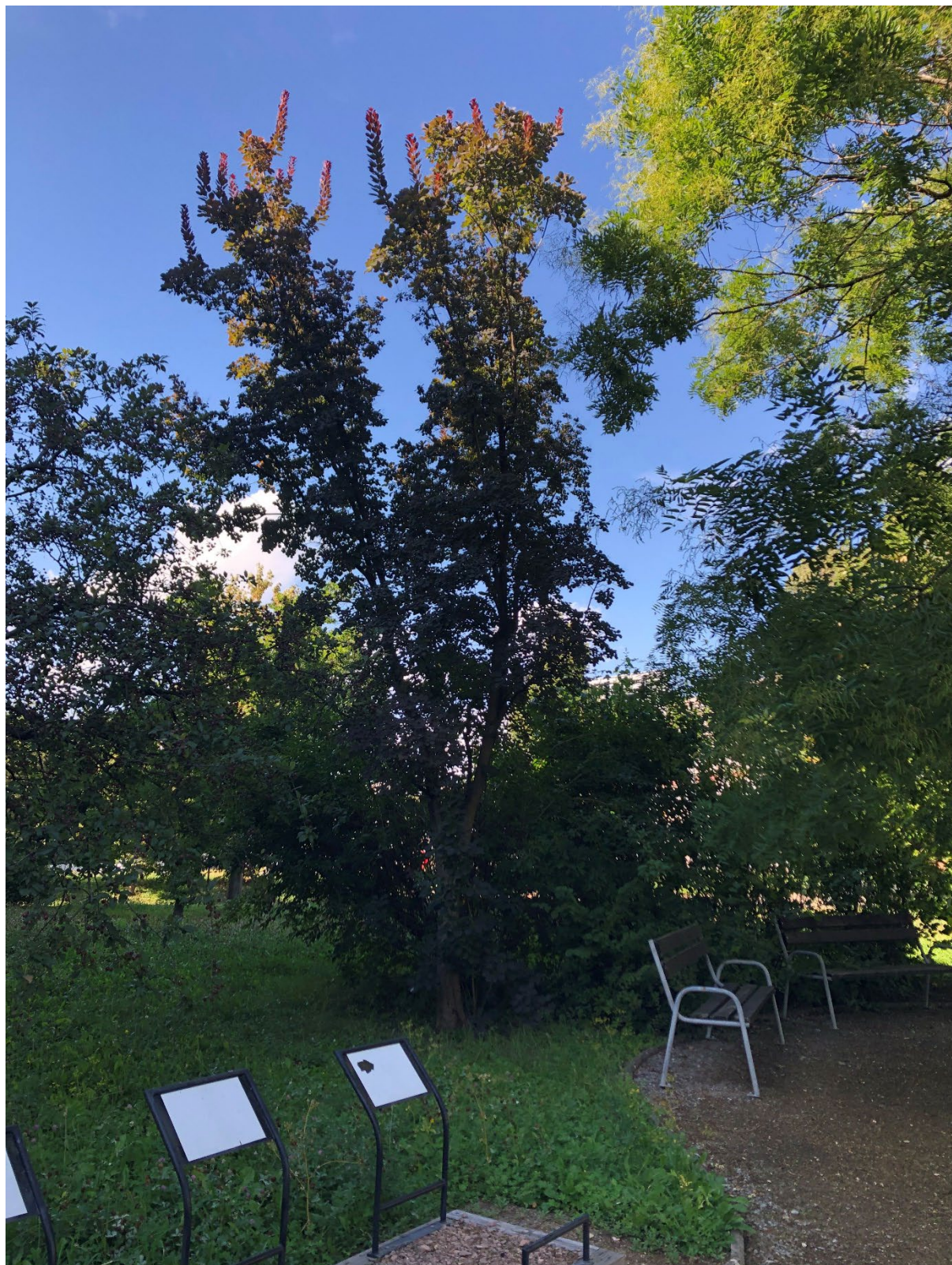
Obr. 6 – Pohled na soubor keřů k odstranění v jižní části řešené plochy