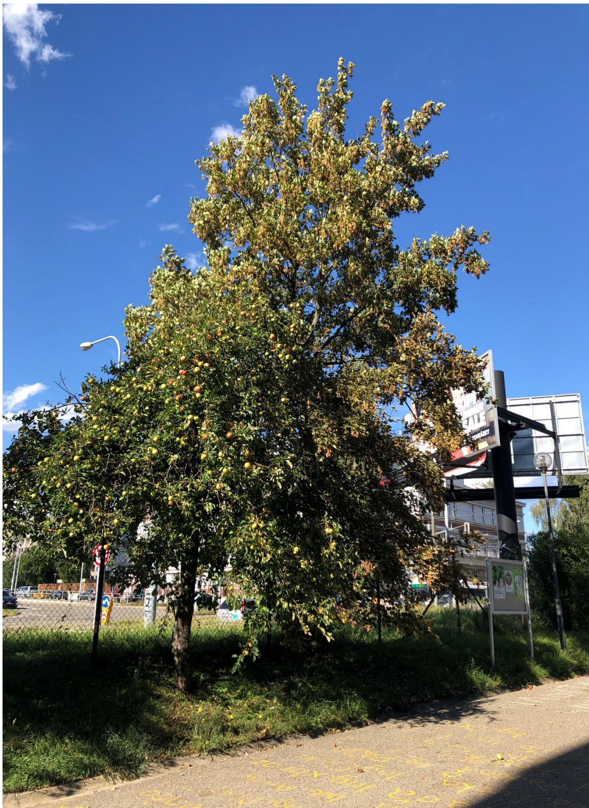
Obr. 3 – Severní pohled na stávající dřeviny určené ke kácení vzhledem k navržené ploše pro uložení kmenů