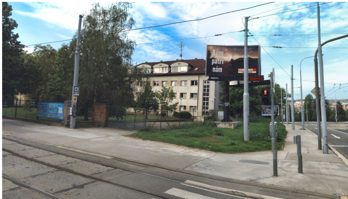
Obr. 1 – Pohled vstup do areálu MENDELU ze severovýchodu