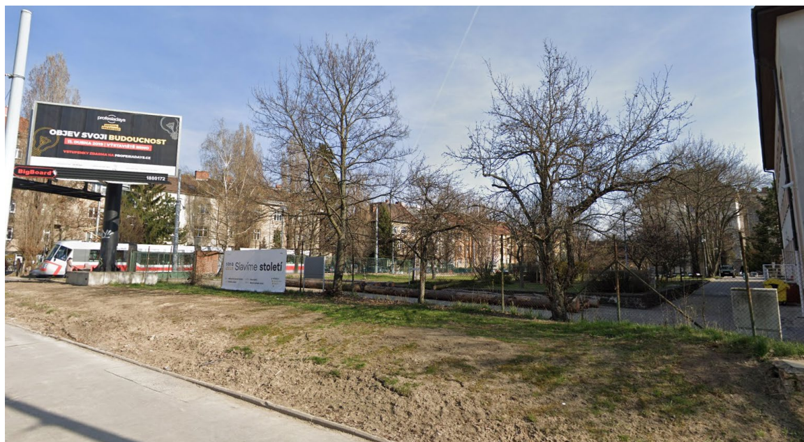
Obr. 2 – Pohled ze severozápadu na část řešené plochy Foto D2C PROJEKT group s.r.o.