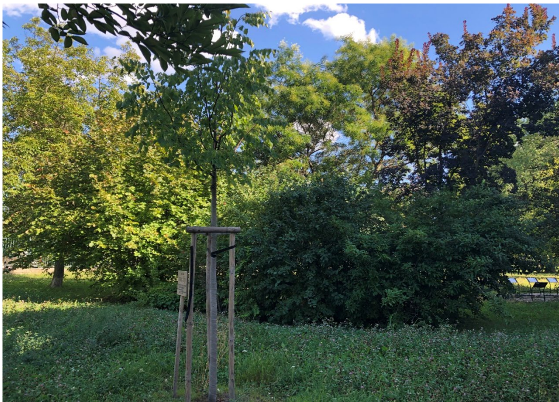
Obr. 5– Pohled soubor keřů k odstranění