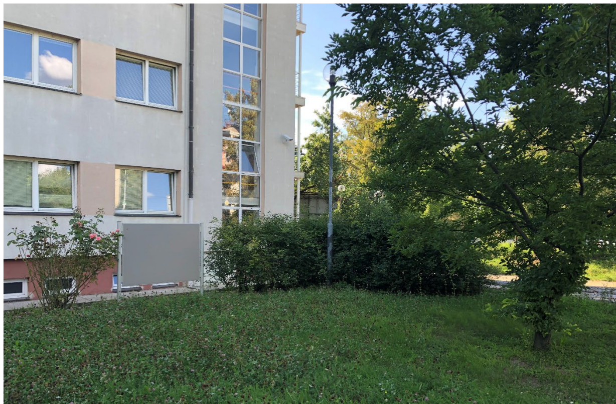
Obr. 7– Pohled soubor keřů k odstranění