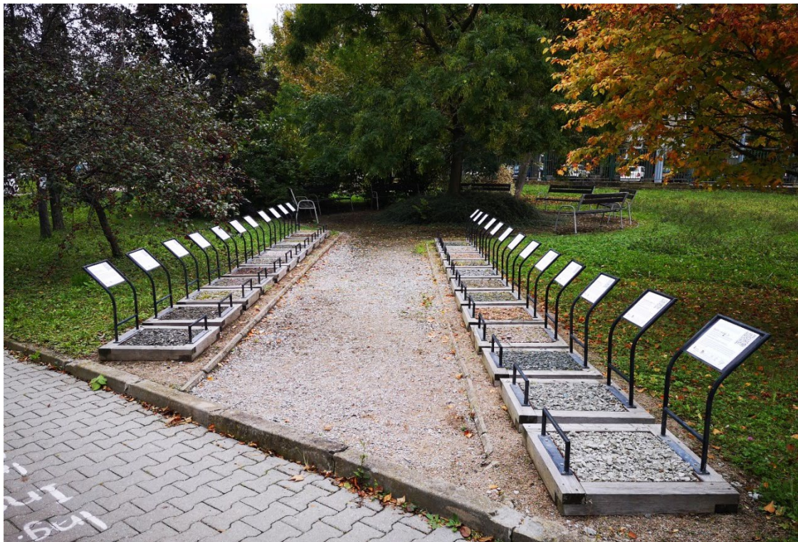
Obr. 4 – Pohled z jihozápadu v areálu MENDELU na část řešené plochy